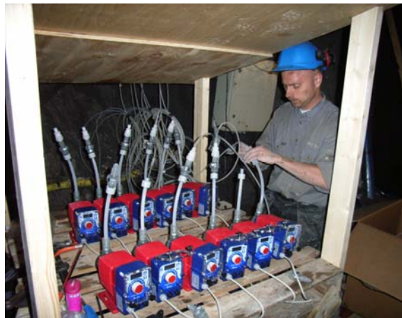
Installation av doseringspumpar för simulering av läckage i berg

Vi installerar all sorts mätutrustning för jord och berg. Med över 20 års erfarenhet av tillverkning, installation och användande av mätutrustning vet vi vad som krävs för en lyckad installation.