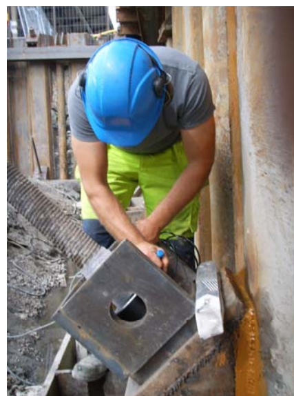
Installation av stagkraftgivare